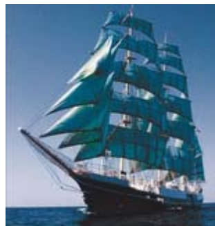
Der Windjammer "Alexander von Humboldt" unter "voll Zeug".